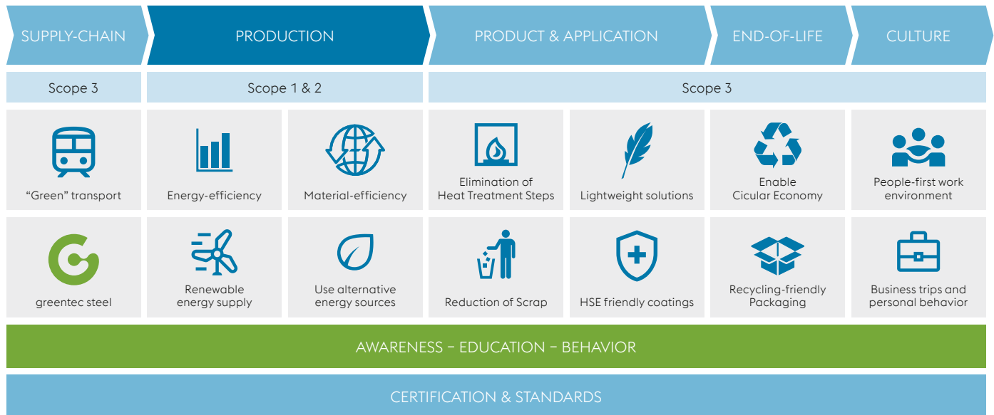
Abbildung 2: Klimastrategie voestalpine Wire Technology

Ein ambitioniertes Ziel erfordert eine ambitionierte Planung. Um das Ziel der CO 2 -Neutralität erreichen zu können, haben wir eine Roadmap 2 Zero entwickelt. Bereits implementierte Maßnahmen zur Senkung des CO 2 -Fußabdrucks sind in unserer Umwelterklärung online zu finden.