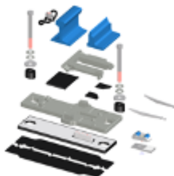
IbaV – System BWG mit integriertem Zungenroller vaRoll